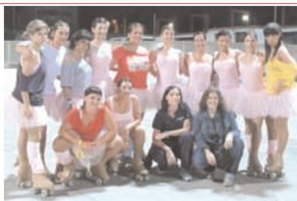
Gruppo Intersocietario Spectacular Skate "Quando la classica incontra la Hip Hop"