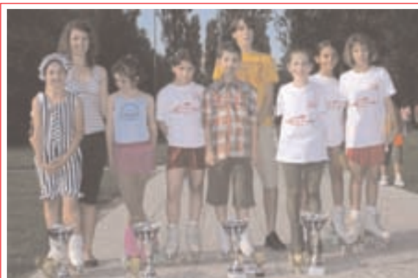
Campionato Regionale Smile, specialità Duetti. Polisportiva Lamae 2° squadra classificata

Ecco il riassunto delle ultime "puntate" della stagione 2007. Grazie a tutti, atleti e famiglie, per avere condiviso con noi questi momenti!