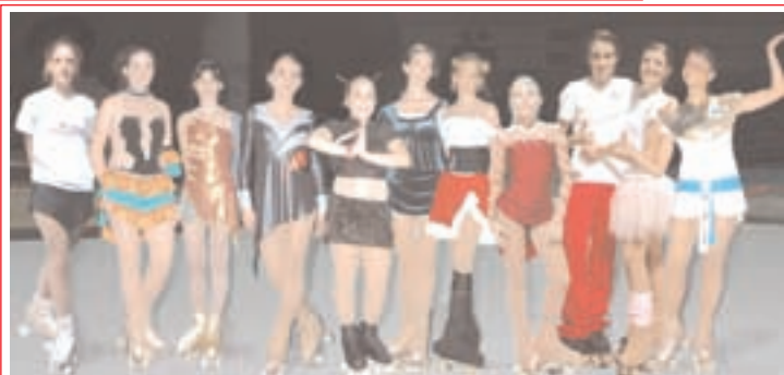
Gruppo Agonistico. Tante di queste atlete ci hanno rappresentato alle prove nazionali delle Gare di Livello e Formula Uisp