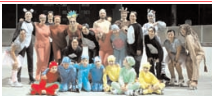
Gruppo Adulti Bradipi a Rotelle in "Madagascar"