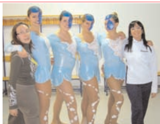
Le atlete dell' Agonistico nel quartetto "Gocce di tempesta" che ha partecipato al Campionato Regionale e al Campionato Italiano Uisp 2007