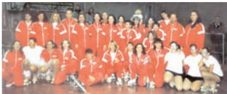
La squadra composta dai Gruppi Adulti Pollame Skating e Bradipi , dal Quartetto e dallo Spectacular Skate che ha partecipato al Trofeo Nazionale per Gruppi a Udine

Ecco che cosa abbiamo fatto nel corso del primo quadrimestre di questa nuova stagione sportiva: non ci siamo fatti mancare aggregazione, amicizia, divertimento, voglia di fare e... nemmeno qualche bel risultato!!!