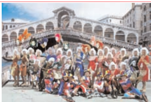
Gruppo Adulti Pollame Skating in "Carnevale a Venezia"