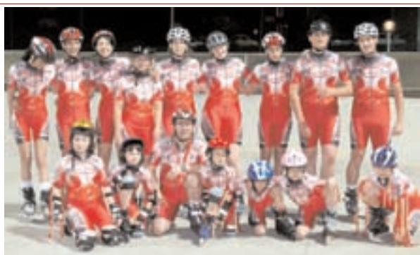
Pattinaggio in linea 2007