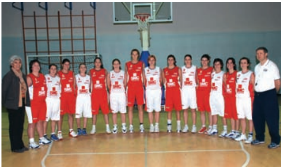
Le due squadre femminili senior: la serie B (sopra) e la serie C (sotto).